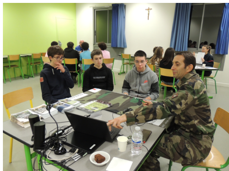
Forum des Métiers au collège pour les élèves de 3ème