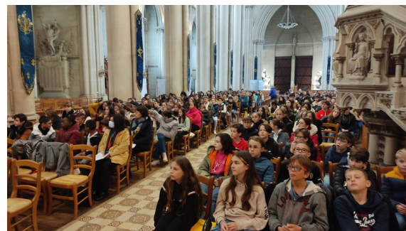
Célébration de Noël